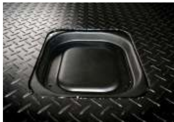
Um par de bocas de escoamento por guarda lateral.