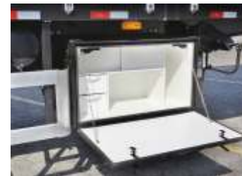
Caixa rancho com acabamento interno em fórmica, equipada com gavetas e borrachas de vedação.