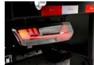
Lanternas traseiras em Led com design moderno.