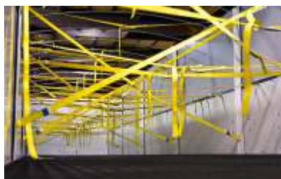
Travamento interno das guardas com cintas de nylon.

Na versão 4 eixos, o primeiro eixo é distanciado, possui suspensão pneumática e sistema direcional (manga de eixo), os demais eixos possuem suspensão mecânica Autolub não necessita de lubrificação, resistente leve e de fácil manutenção.