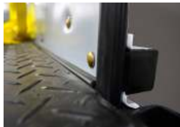
Sistema de vedação lateral e inferior no assoalho, garantindo total estanqueidade da carga.