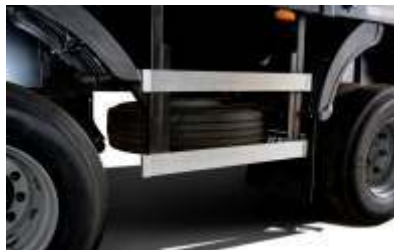
Dois porta estepes do tipo catraca, posicionados entre o primeiro e segundo eixo.